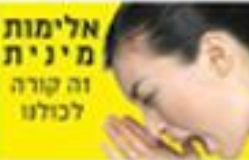
אלימות מינית זה קורה לכולנו

"המדריך למתלוננת הטובה" לינוי בר גפן התלוננת מיד? הזויה ; התלוננת אחרי שנה? - עכשיו באים? | הכרת אותו? אז היה רומן ; לא הכרת אותו? - את רוצה להתפרסם | היית קטינה? פחחח הנוער של ימינו ; היית בגירה? - איך אישה חזקה כמוך נופלת בפח? | את רזה? אנורקטית ממורמרת ; את שמנה? - עלאק מישהו יגע בכך | היו עדים? אורגיה ; לא היו עדים? - אז אין לך ראיות | זה קרוב משפחה? - רצית צומי | זה חבר? - קינאת | זה הבוס? - ניסית לסחוט קידום | זה גבר זר? - תסתכלי מה את לובשת | קפאת - אין כזה דבר ; צעקת? - חבל לא שמענו היית צריכה לבעוט | העדות שלך קוהרנטית? סימן שעשית חזרות על התפקיד ; העדות מבולבלת? סימן שאת לא אמינה | בתולה? אז את לא יודעת לפרש כוונות ; לא בתולה? נו, עוד שרמוטה | יש עדות לתקשורת? חכו לעדות במשטרה | אה היא הגיעה למשטרה? חכו לפרקליטות | יש פרקליטות? חכו להרשעה יש הרשעה? חכו לערעור | יש ערעור? חכו לעליון | יש עליון? רדפו אותו כי הוא עשיר / עני / ג'ינג'י / מפורסם / אנונימי / דתי / חילוני / ערבי / קורבן קונספירציה